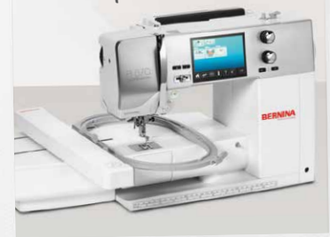
B 570 QE con módulo de bordar (opcional)

La B 570 QE es un verdadero multitalento, puede coser, acolchar y bordar. El cambio de la función de costura al bordado se efectúa cómodamente mediante la pantalla táctil. Se encuentran integrados en la propia máquina 50 diseños de bordado. Los diseños de bordado pueden ser cargados por medio de un puerto USB. Todos los diseños de bordado se pueden rotar, espejar, aumentar, disminuir o cambiar de color directamente mediante la pantalla táctil.